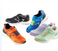
ジュニアスニーカー ¥980(税込¥1,078)