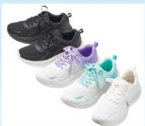
JOG弾スニーカー ¥980(税込¥1,078)

片足90gの軽さと土踏まずのアーチに吸い付く立体インソールで、忙しい女性の足元をサポート!