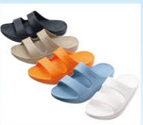
リカパリーサンダル ¥499(税込¥548)

優れた反発弾性と耐久性を兼ね備えた独自開発のアウトソールは、どこまで歩いてもずっと快適!