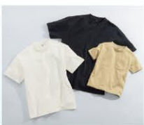
COOL Limit ビッグTシャツ ¥499(税込¥548)

吸汗速乾・接触冷感でひんやりサラリとした着心地!存在感のあるビッグTシャツです。