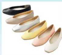
ふわりっとな®エアリー ¥780(税込¥858)

片足90gの軽さと土踏まずのアーチに吸い付く立体インソールで、忙しい女性の足元をサポート!