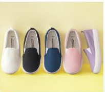
キッズスリッポン ¥380(税込¥418)

吸汗速乾・接触冷感でひんやりサラリとした着心地!存在感のあるビッグTシャツです。